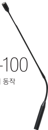
GM-100 팬텀파워 동작