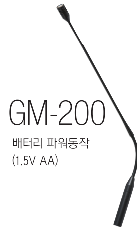
GM-200 배터리 파워동작 (1.5V AA)